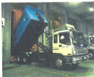
商品廃棄が多いオリックス資源循環では、梱包を解かず排出事業者の担当者の眼前で処理施設に投じる

商品には当然、企業名が刻まれている。不適正処理されればブランドの信用が失墜しかねない。そうした廃棄物のリスクを重く受け止める企