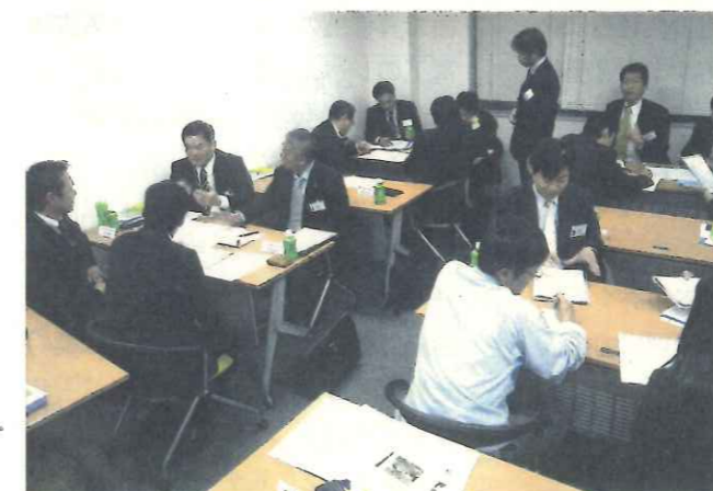
11月22日のESJの研修では、現場の運転手の教育について、16の企業の責任者が熱心に議論した

排出事業者の厳しいまなざしを受けて、産廃業界も変わりつつある。全国産業廃棄物連合会青年部の有志が共同出資で立ち上げ、加盟企業の教育研修などを実施しているエコス