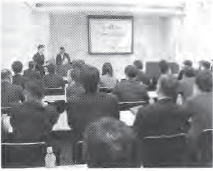
熱気あふれる会場

代表団の王莉市環境 保護局長は「市政府と しても、(日系企業の進 出に)支援策を講じる。 環境産業や静脈産業に か」など具体的な質問 が相次いだ。